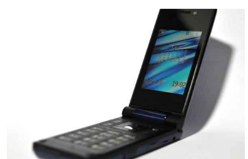
携帯電話 6M150 (マグネ上の塗装剥離)