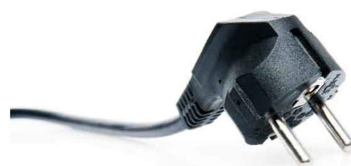
コネクタ SD-509 (スズ・半田めっき剥離)