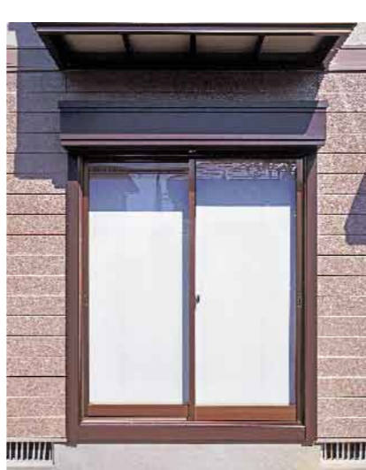
アルミサッシ 6L146 (アルミ上の塗装剥離)