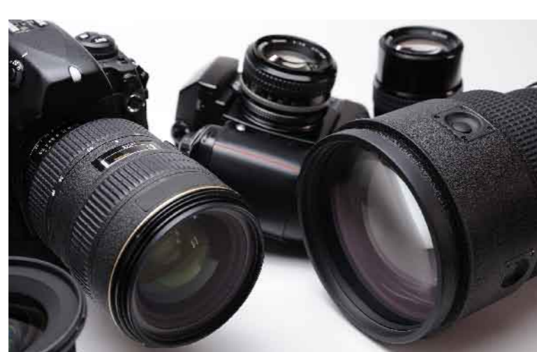
カメラ 6M150 (ステンレス上の塗装剥離)